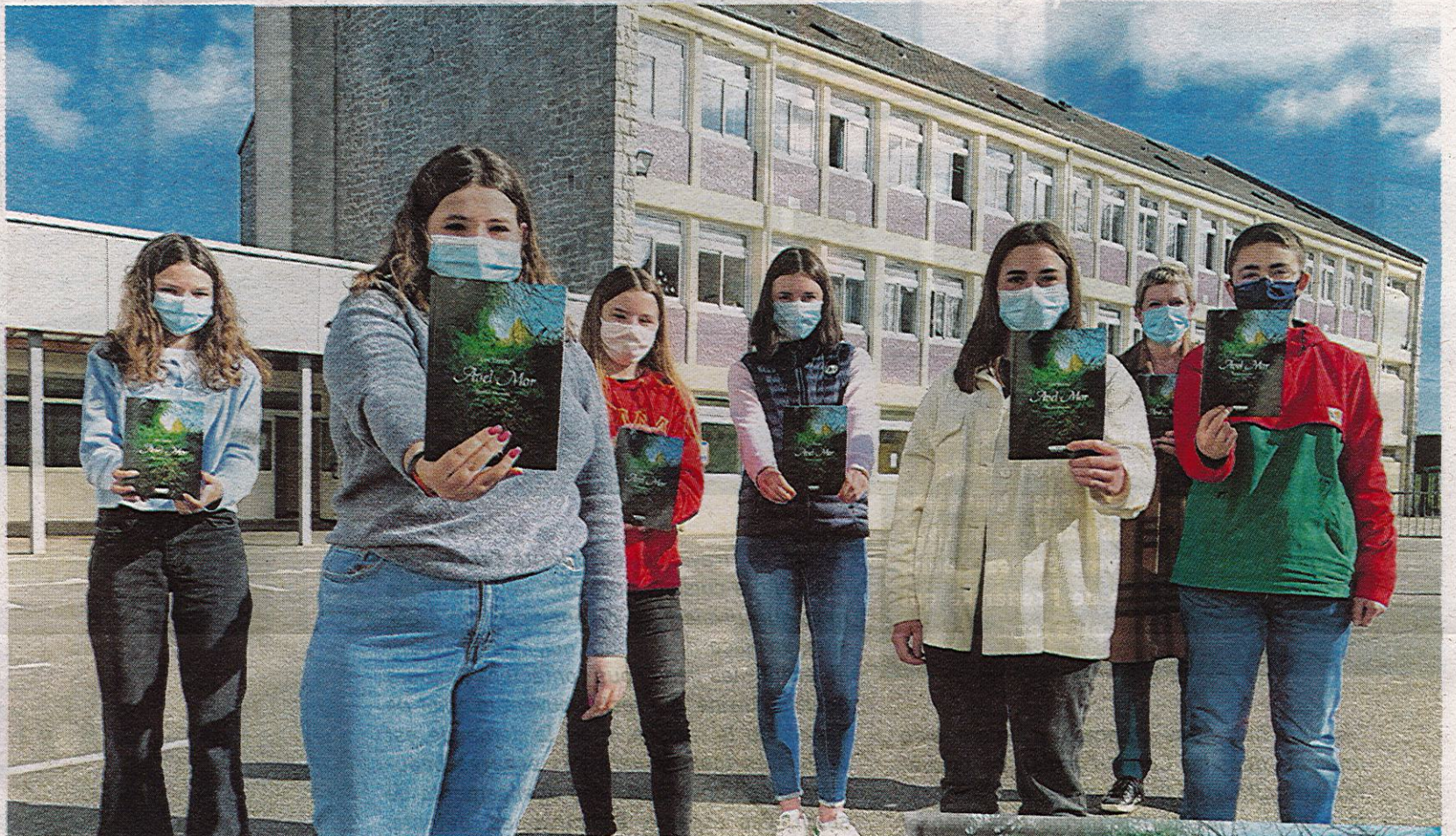
Une toute petite partie des auteurs d' Avel Mor . Ils sont maintenant en classe de troisième car situation sanitaire oblige, la publication a pris du retard, mais ils restent fiers de leur travail et il y a de quoi !

Elle a dû fournir, on l'imagine, un immense travail de coordination et (un peu) de correction orthographique.